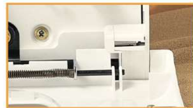
Sicherheitsschalter für geöffneten Frontdeckel