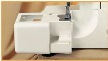
Freiarm: Rundnähen ist ein Kinderspiel

Eine Overlockmaschine - Viele Möglichkeiten und Vorzüge!