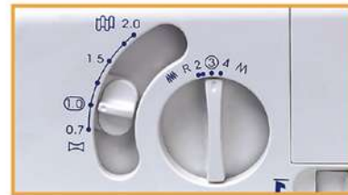
Einfaches Einstellen der Stichlänge und des Differenzialtransports!