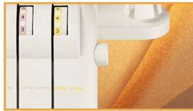
Fadenspannungslüfter: Einfaches Lösen der Fadenspannung