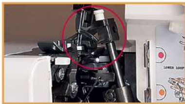
2-Faden-Nähen – mit Adapter möglich!