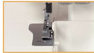
Eingebauter Rollsaum: Rollsaumnähen ohne Stichplattenumbau